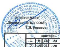
График учебного процесса на 2024-2025 уч. год (новый стандарт)